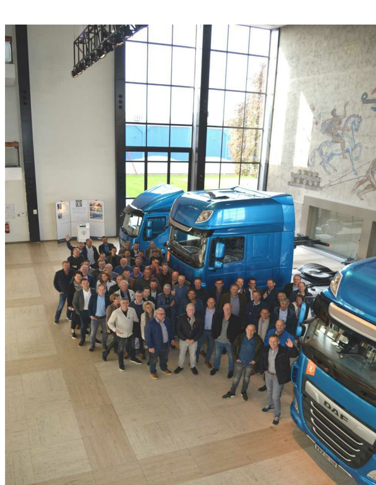
Thank you for visiting DAF Trucks NV

Op 2-10-2018 hebben we met meer dan 80 ondernemers een bedrijvenbezoek gehad bij DAF Eindhoven. Voor het eerste in de geschiedenis was een laatste herinnering niet meer nodig. Er waren namelijk meer aanmeldingen dan beschikbare plaatsen. Dit werd uiteindelijk opgelost door een deel van de groep een rondleiding in het museum van DAF te geven met een drankje en een hapje. Ook daar waren de reacties enthousiast. Het bedrijvenbezoek zelf was indrukwekkend. Met bijna 10.000 werknemers en bijna 70.000 trucks per jaar is DAF 1 vd grootste spelers van de wereld. Filevorming op het terrein van DAF was dan ook geen incident. Na geborrel te hebben in Eindhoven centrum hebben we de avond afgesloten met een etentje bij de Toren in Heeswijk-Dinther. Een erg leuke dag. De lat is hoog gelegd voor 2019 waar de organisatie alweer druk mee doende is.